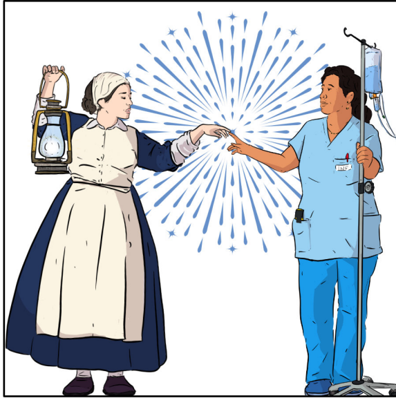
De la "dama del fanal", Nightingale de l'avior, a la infermera actual hi ha anys d'evolució.