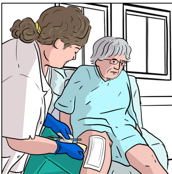
Som col·lectiu implicat en l'autocura diària sempre feim de l'usuari centre de l'activitat.