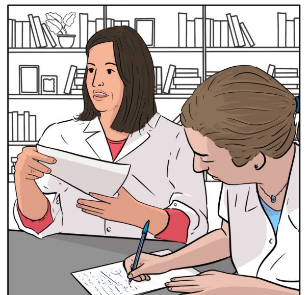
Avançar en la professió no és sols curar dia a dia, i així és com la infermeria creix fent investigació.