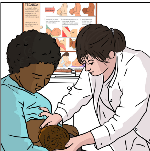
La tasca infermera és far que dona llum i energia per conferir autonomia a la família, a la llar.