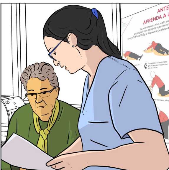
És un treball convençut que cerca la sintonia per lluitar amb la malaltia mentre promou la salut.