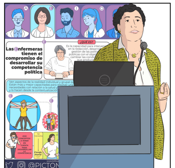
Som les grans professionals i excel·lim en la funció d'ocupar llocs de gestió a institucions i hospitals.