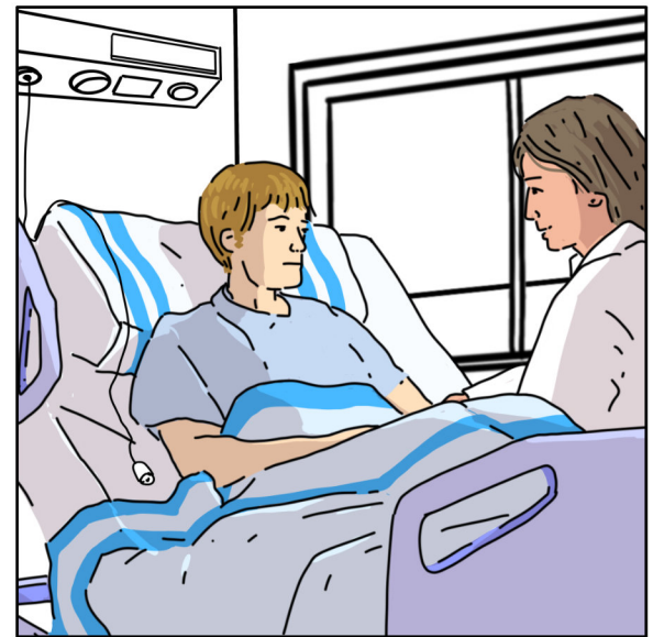
És una feina eficient, que confereix el poder a l'individu per ser autònom i independent.