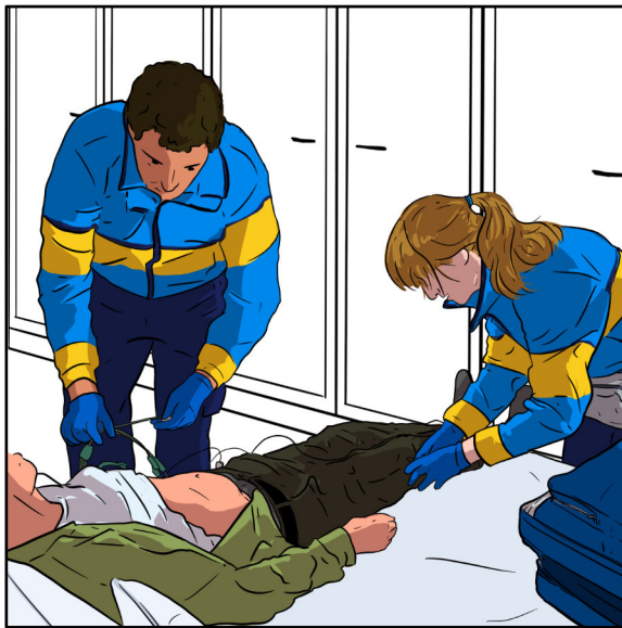
Com que el camí cuidador és una tasca global, la bona professional cura en col·laboració.